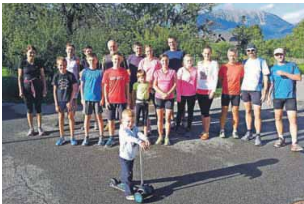
Športnega dela prireditve se je udeležilo 18 tekačev in 16 pohodnikov, večernega pa skoraj sto prebivalcev Langusove ulice.

Matevža Langusa v Kamni Gorici za tiste, ki radi hodijo, tek po isti trasi za tiste, ki radi tečejo, in tekmovanje za naj sladico za tiste, ki raje pečejo kot hodijo in tečejo.