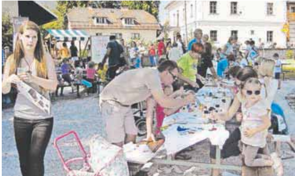
Dan za druženje mladih in starih

Tradicionalno so prišli tudi slikarji – nekateri s stojali in praznimi platni pod pazduho, drugi kar s slikami za na razstavo. Sobotno dogajanje so zaključili športno: s tekom in pohodom iz Radovljice v Kamno Gorico ter pohodom do t. i. moške vode, ki ga je pri-