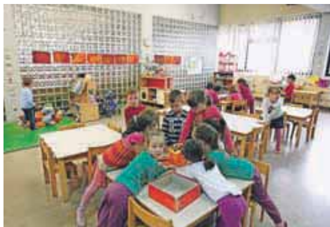
Dva oddelka vrtca Lesce sta tudi v prostorih tamkajšnje osnovne šole, kjer so eno igralnico uredili kar v pregrajeni šolski avli.