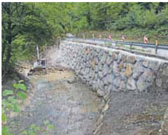
Gradnja podpornega zidu je bila nujna, saj se je vozišče na tem delu že močno posedlo.