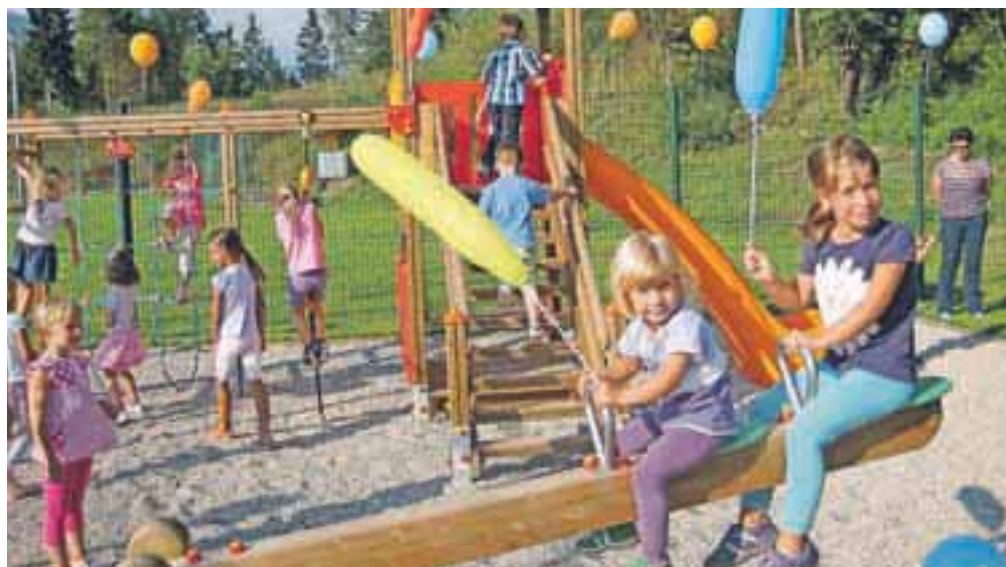
Na otroškem igrišču, velikem petsto kvadratnih metrov, je postavljenih deset igral, klop in koš za smeti. Uredili so tudi dostopno pot do njega.

janju igrišča pomagala tudi Gorenjska gradbena družba, saj je bilo treba urediti dovoljno pot, ki igrišče povezuje z nekaj oddaljenim centrom vasi, ter s kar 450 tonami utrditi teren, na katerega so postavili igrala.