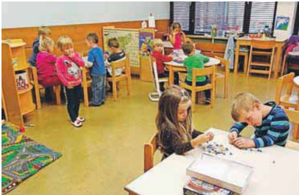
V sedem enot radovljiških vrtcev so v letošnjem šolskem letu lahko sprejeli vse otroke.

Priprave na gradnjo že tečejo, težko pričakovani prizidek k vrtcu v Lescah pa naj bi bil dokončan do konca maja prihodnje leto. V prizidku s površino 750 kvadratnih metrov bo pet novih igralnic za tri oddelke prvega in dva oddelka drugega starostnega obdobja ter dodatna igralnica za različne dejavnosti otrok. Ko bo gradnja prizidka končana, bo junija sledila rekonstrukcija obstoječe stavbe vrtca, ki jo bodo po načrtih končali do konca poletja, avgusta prihodnje leto. V tem delu bodo opravili energetske sanacije, v mansardi uredili zbornico, knjižnico in prostore za osebje, povečali in preuredili bodo pralnico in kuhinjo ter eno od igralnic znova uredili za športno dejavnost. V nekdanji telovadnici sta namreč zdaj zaradi prostorske stiske urejeni dve igralnici, dva oddelka otrok pa gostujeta v bližnji osnovni šoli. V novem delu stavbe bo vgrajeno dvigalo, na dostopih v vrtec bodo urejene klančine, zgrajeno bo tudi parkirišče. V vrtcu Lesce je trenutno prostor za 8 oddelkov (še 2 delujeta v osnovni šoli), po zaključku obeh naložb pa bo lahko odprtih 11 oddelkov.