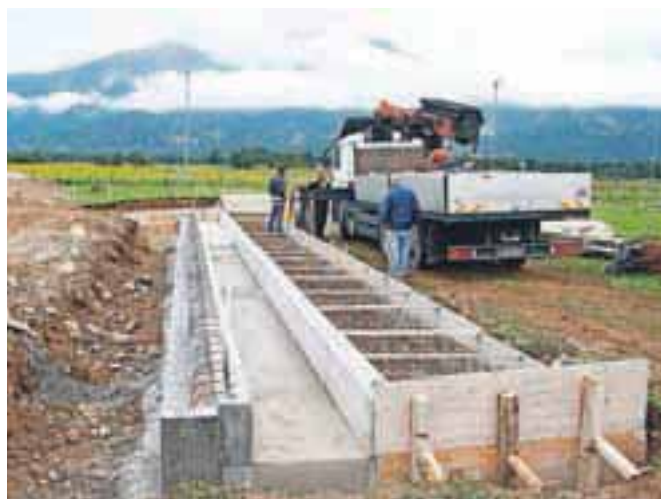
Zaradi postavljanja skulpture bo promet v krožišču predvidoma oviran do konca oktobra.

Gradbena dela za postavitev skulpture na krožišču je v začetku septembra začela izvajati Gorenjska gradbena družba. Zaključena bodo do konca septembra, nato pa se bo začelo postavljanje skulpture. Promet v krožišču bo v skladu z dovoljenjem Direkcije RS za ceste predvidoma oviran do konca oktobra.