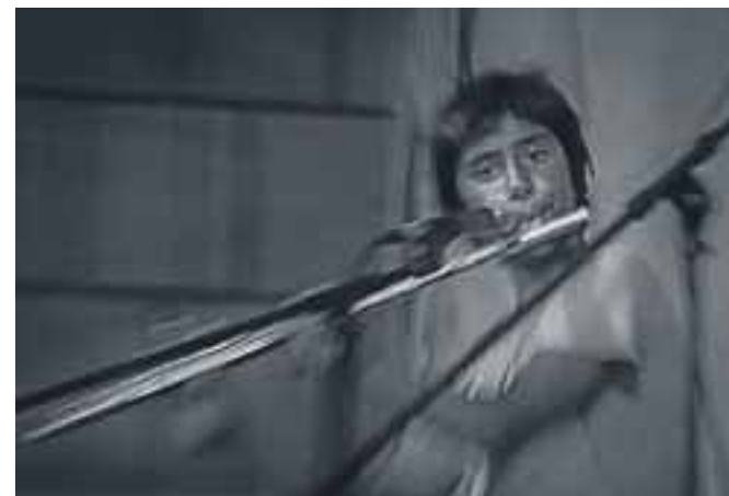
Dogodki v občini Radovljica 2012: Terrafolk, avtor Bor Rojnik (diploma)