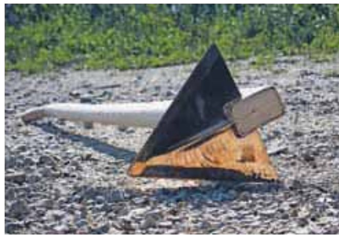
Tomaževa masivna motika Vesna

»Njegovo moč so koristili tudi pri delu z rastlinami na njivah in vrtovih, saj so tako