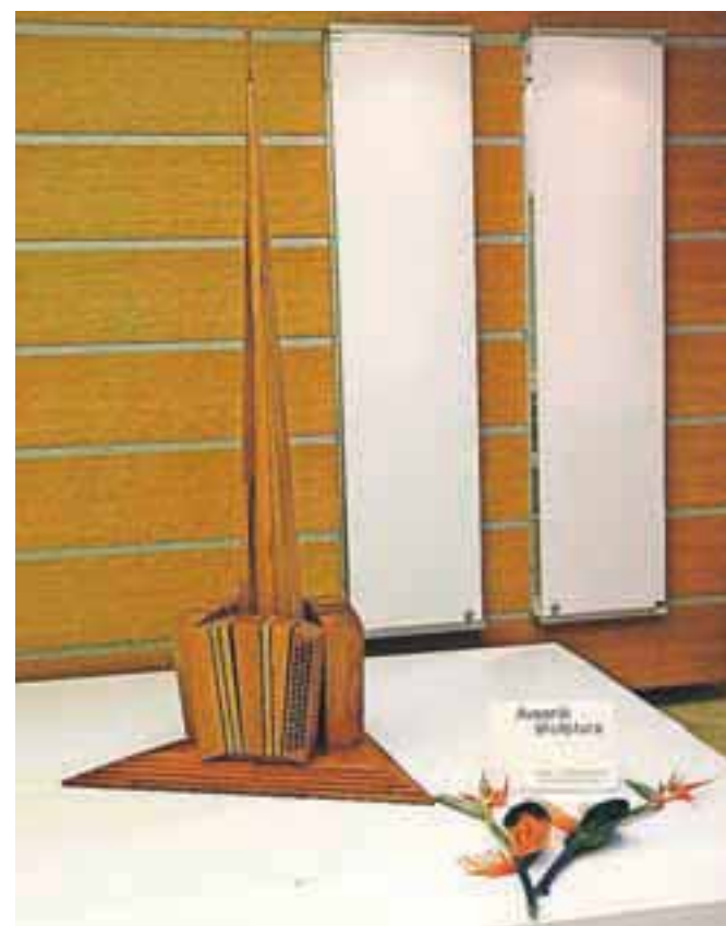
Maketa skulpture, posvečena Avsenikovi glasbi, kakršna bo stala na krožišču.