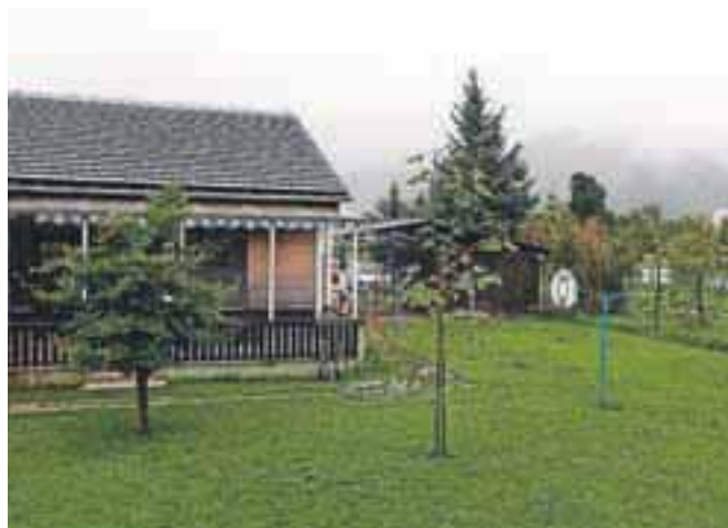
Če bo šlo vse po načrtih, bo že do pomladi zgrajen prizidek k vrtcu v Lescah, takoj za tem bodo nadaljevali obnovo starega dela stavbe.

seveda lotili tudi terase. Najmlajši jo prav gotovo potrebujejo, saj se še veliko plazijo po tleh in asfaltno dvorišče za to zares ni najbolj primerno.« Na dolgi rok pa razmišljajo o telovadnici. Zanj bi tudi v Radovljici potrebovali prizidek, v katerega bi umestili še kakšno igralnico pa morda pisarne. Uprava vrtca namreč v stari stavbi, kjer ima prostore tudi Center za socialno delo, verjetno na daljši rok ne bo mogla ostati.