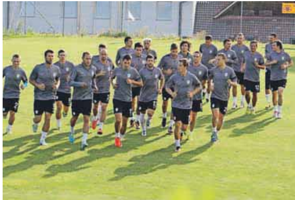
Reprezentanti v Lescah

pomembno tekmo v Stožicah prav na leškem igrišču. Generalka bo ostala v lepem spominu, saj je bila naslednji dan izbrana vrsta uspešna. Albance so premagali z 1 : 0.