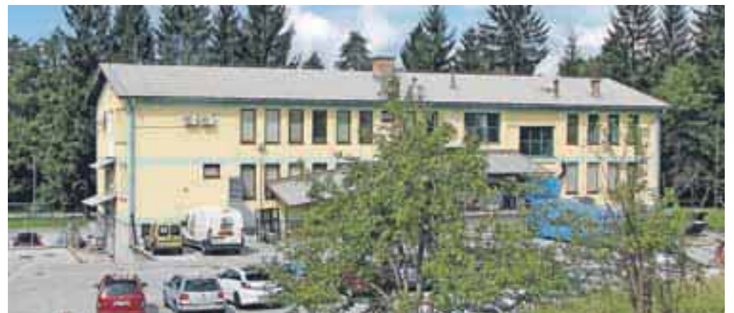
Pred dvajsetimi leti se je Tiskarna knjigoveznica Radovljica z Linhartovega trga preselila v prostore nekdanje vojašnice v Predtrgu.

Podjetje je ob ustanovitvi imelo le tiskarski stroj na ročni pogon, rezalni stroj in najnujnejše naprave za izdelovanje razglednic. Iz skromnih prostorov v starem delu Radovljice se je podjetje iz leta v leto tehnološko razvijalo, saj je po letu 1990 prešlo na offset tisk, in povečevalo število zaposlenih. Prostorska stiska in denacionalizacijski zahtevki so bili leta 1991 razlog za selitev v sedanjo stavbo. Prostore vojašnice v Radovljici so najprej najeli, nato pa od Ministrstva za