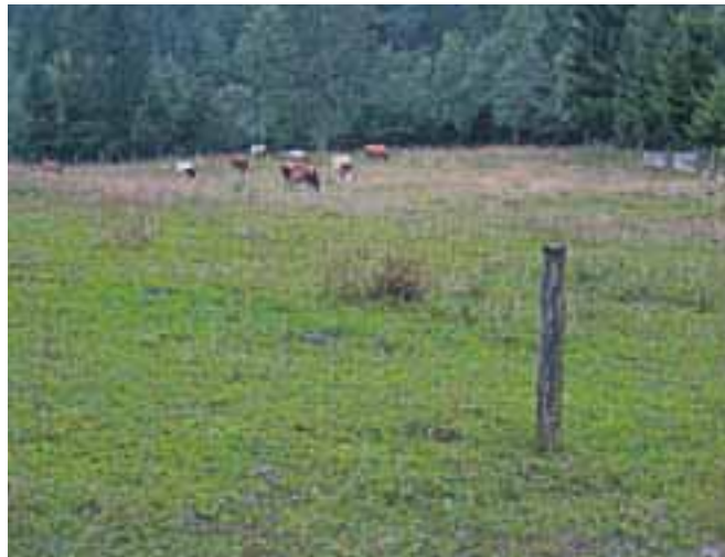
V Dragi se od pomladi do jeseni pase živina.

»Najožji vodovarstveni pas vodnega vira Draga je zavarovan z varovalno ograjo, ki fizično preprečuje dostop do ožjega vodovarstvenega območja,« pojasnjujejo in dodajajo, da vodo iz zajetja Draga sicer redno dezinficirajo od leta od leta 2007. »Ukrep minimalne preventivne dezinfekcije je bil na vodnem viru uveden zaradi občasnih poslabšanj mikrobioloških preizkusov pitne vode, ki so bila značilna ob znatnejših padavinah in s tem povečanim vplivom površinske vode. V tem obdobju rezultati vzorčenja niso pokazali drugih vplivov na kakovost vode,« še pojasnjujejo na Komunali.