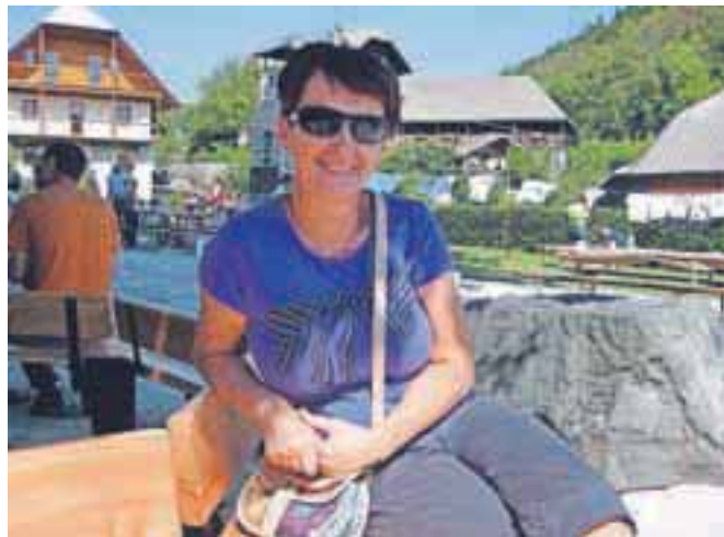
Tea Beton na novi klopi, ki so jo postavili pri lipi sredi vasi.